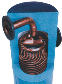
Rohrbündel im Mantel

Siehe Fließschema des betreffenden Wärmeübertragertyps. Im Allgemeinen sollte das Medium mit der niedrigeren Durchflussrate durch das Rohrbündel geleitet werden. Bitte beachten: Brauchwarmwasser muss immer durch das Rohrbündel fließen.